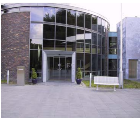
Udluftnings bånd i glasfacade