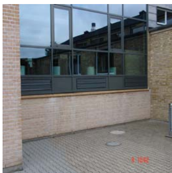
Under vinduer – over sokkel