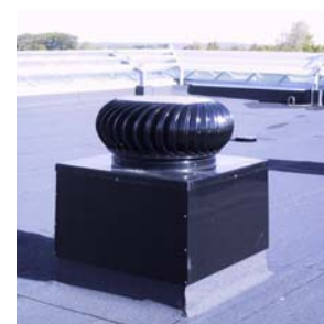
Indfarvet taghætte / vind + motor drevet