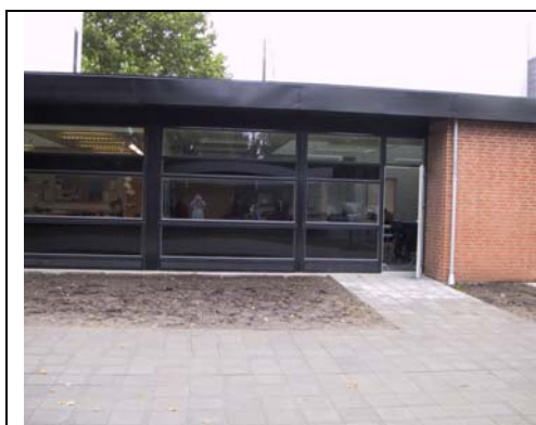
Lyshøj skolen i Kolding

Luft indtag i jordhøjde under vinduespartier.