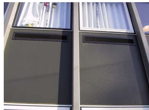
Luft indtag under vindue, indfarvet = facadepladen