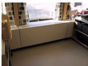
Konvektors kabinet indenfor