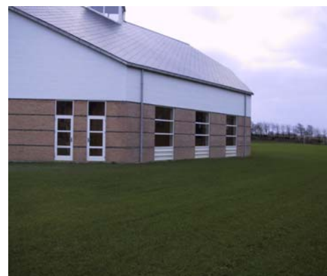
Under vinduesfelter i gymnastiksal