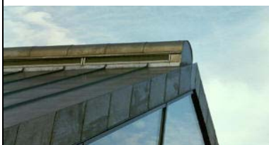
Nova-Air spjæld i tagryg som luftafkast