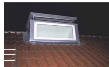
Udluftning øverst i front på kvist