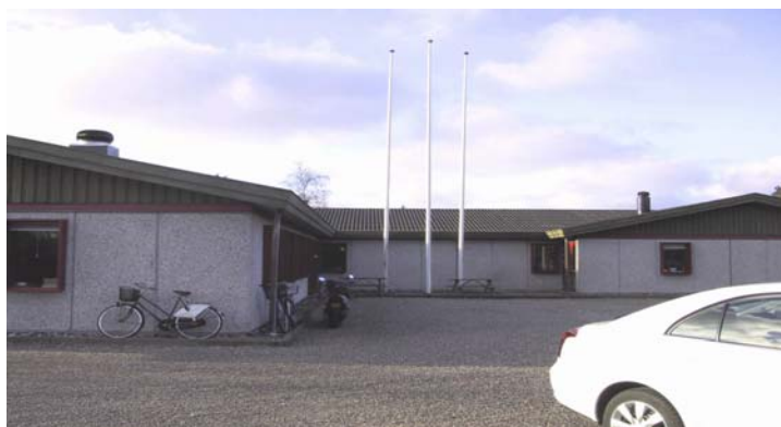
Eksempel på flere vinddrevne taghætter med vindassisterede turbiner