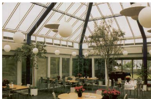
Som udluftningsbånd under glastag i center / fællesrum