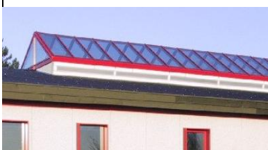
Udluftning under rytterlys

= justerbar åbning (uden egen drivkraft)