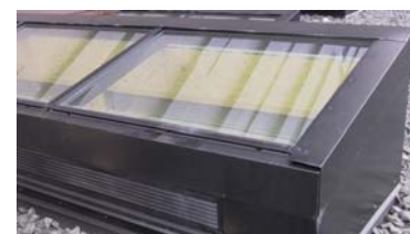
Nova-Air udluftning i ovenlys på taget