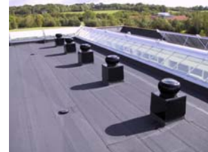
Sorte taghætter på fladt tag